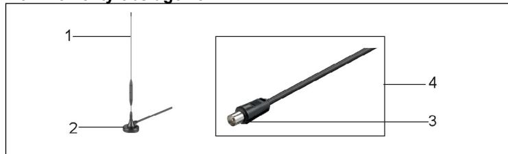
1 Pręt antenowy 2 Stoisko