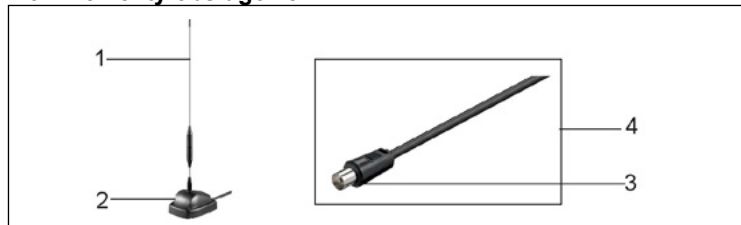
1 Pręt antenowy 2 Stoisko