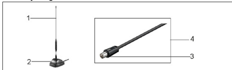
1 Antenne stang 2 Stand