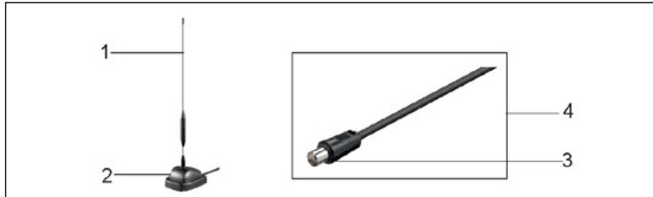
1 Anténní tyč 2 Stojan