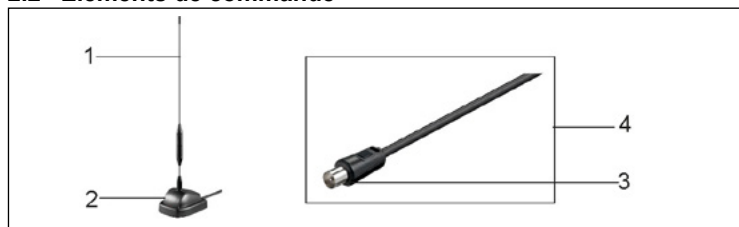
1 Tige de l'antenne 2 Socle